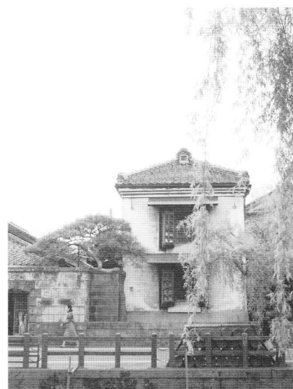
表紙、裏共に千葉県佐原市(現・香取市)(関連記事:p22)