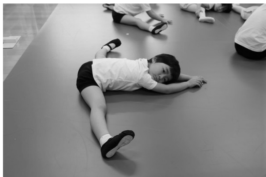
ストレッチの様子

ボーカルもパーカッションもない音楽は、最初はリズムの取り方が難しいようでしたが、鏡の前で練習することでお友達と動きを合わせようとする姿が見られ、次第にみんなの動きが揃っていきます。