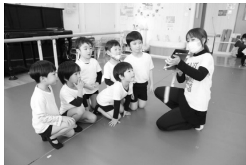
演技を確認する子ども達

男の子と女の子にクラスを分けて、発表会に向けた作品づくりを始めました。最初は、振り付けをなかなか覚えることができませんでした。が、上手にできている部分を褒め、子どもの主体性、自主性、自発性を伸ばすことを大切に指導していきました。できた子がまだできていない子に教える姿も見られ、やさしさや感謝、お互いを尊重し合うといった心の成長も感じることができました。