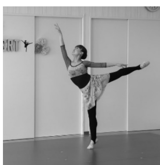
指導者による演技披露