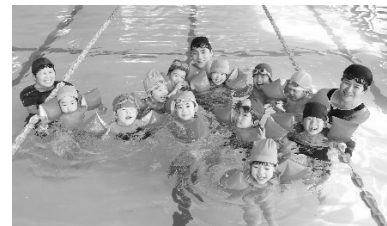
キッズスイミング

運動をコントロールする能力が顕著に伸びる幼児期に、体幹やバランス感覚の向上、表現力の向上が期待されるバレエを取り入れたいという想いと、年間を通じて学んだバレエ