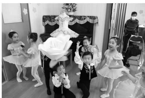
終了後の写真撮影会