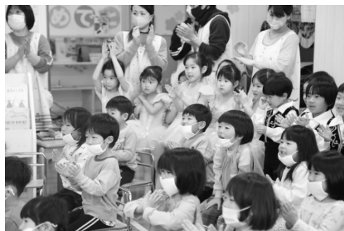
バレエを観る子ども達

かなり緊張した様子でしたが、舞台に立つと表情が変わり、演技に集中することができました。お兄ちゃん、お姉ちゃんたちの堂々とした演技を観たお友達の中にはすぐに真似をする子どもの姿も見られ、「自分も早くバレエを習いたい！」といった声も多くありました。