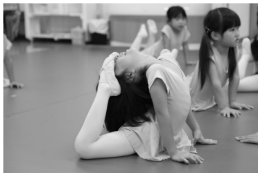
ストレッチの様子