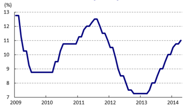
図1 政策金利(Selic)の推移