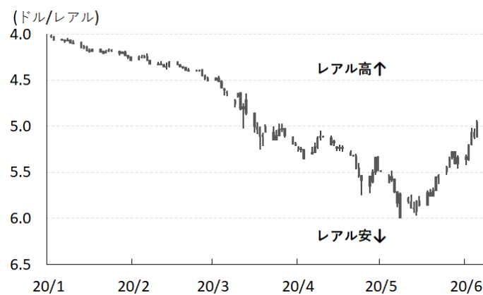
図3 レアル相場(対ドル)の推移